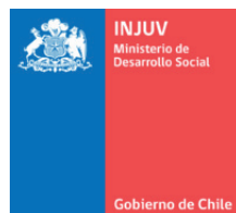
Instituto Nacional de la Juventud