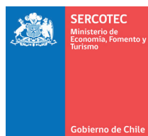
Servicio de Cooperación Técnica