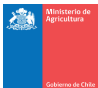
Ministerio de Agricultura