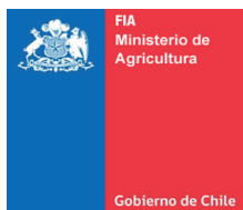
Fondo para la Innovación Agraria