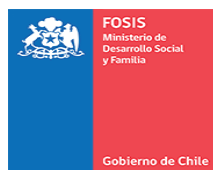
Fondo de Solidaridad e Inversión Social