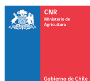
Comisión Nacional de Riego