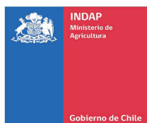
Instituto de Desarrollo Agropecuario