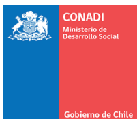
Corporación Nacional de Desarrollo Indígena