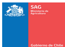
Servicio Agrícola y Ganadero