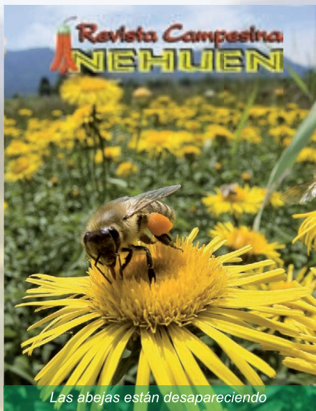
Las abejas están desapareciendo

Pero...la mitad de las sociedades de abejas desaparecieron o murieron durante el año 2005, al perder su capacidad de orientación para encontrar el camino de regreso a casa donde las larvas hambrientas esperaban por el néctar de vida. Ya en el año 1995, los franceses reportaban que 1/3 de las sociedades de abejas habían desaparecido. Casi inmediatamente después ocurrió lo mismo en Alemania, Polonia, España y Suiza. Las causas eran desconocidas pero se sospechaba que las abejas sufrían alteraciones en la orientación por efecto de los campos magnéticos, creados por la creciente red de comunicación telefónica inalámbrica y el levantamiento masivo de antenas repetitivas de las señales, en el creciente mercado de la telecomunicación celular. También expertos norteamericanos, han llegado a la conclusión que con gran seguridad, el responsable de este drama sufrido por las abejas es un insecticida distribuido por la empresa biotecnológica alemana Bayer , de nombre Imidacloprid . Este compuesto fue colocado en el mercado en 1994 para combatir los parásitos de las hojas,