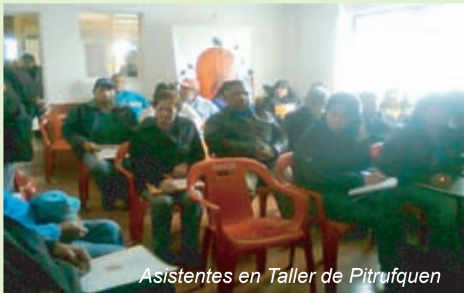
Asistentes en Taller de Pitrufquén

El día 23 de Septiembre del presente año la Confederación Nacional Campesina de Chile Neuquén realizó el Taller de Fortalecimiento Orgánico en la Comuna de Pitrufquén , IX Región, en concordancia con los objetivos y metas trazadas con el Proyecto Progyso 2011 .