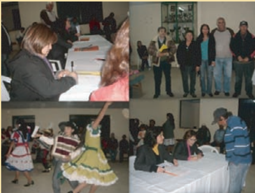
Constitución del Sindicato Los Morales IV Región.